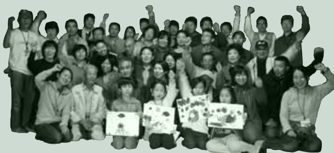
昨年の里人塾生たち。地元住民も都市住民も、子どもたちも皆「里人」だ

「栃尾里人塾」が目指すのは、これからの新しい里づくり。あなたも一緒にやるまいか！