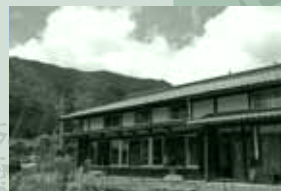
げんねもん 古民家 源右衛門 栃尾里人塾の拠点は、この集落をずっと見つめてきた築100余年の古民家。吉田川が流れ、栃尾の山々に囲まれている。