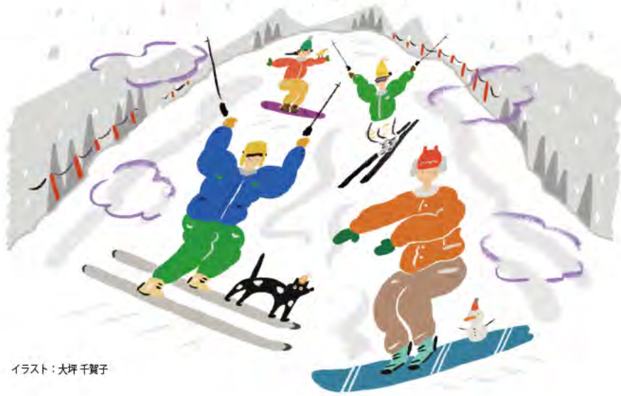
イラスト：大坪千賀子